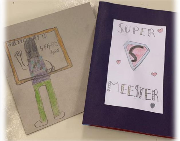
Groep 8 heeft Kanjerkaarten gemaakt voor elkaar