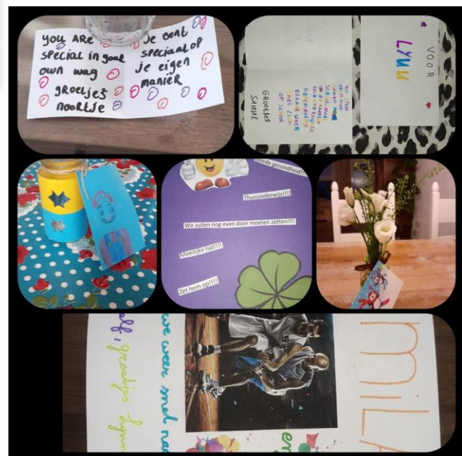
Gelukkigwensen van groep 7