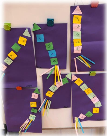
Groep 1/2: letterraket met je naam